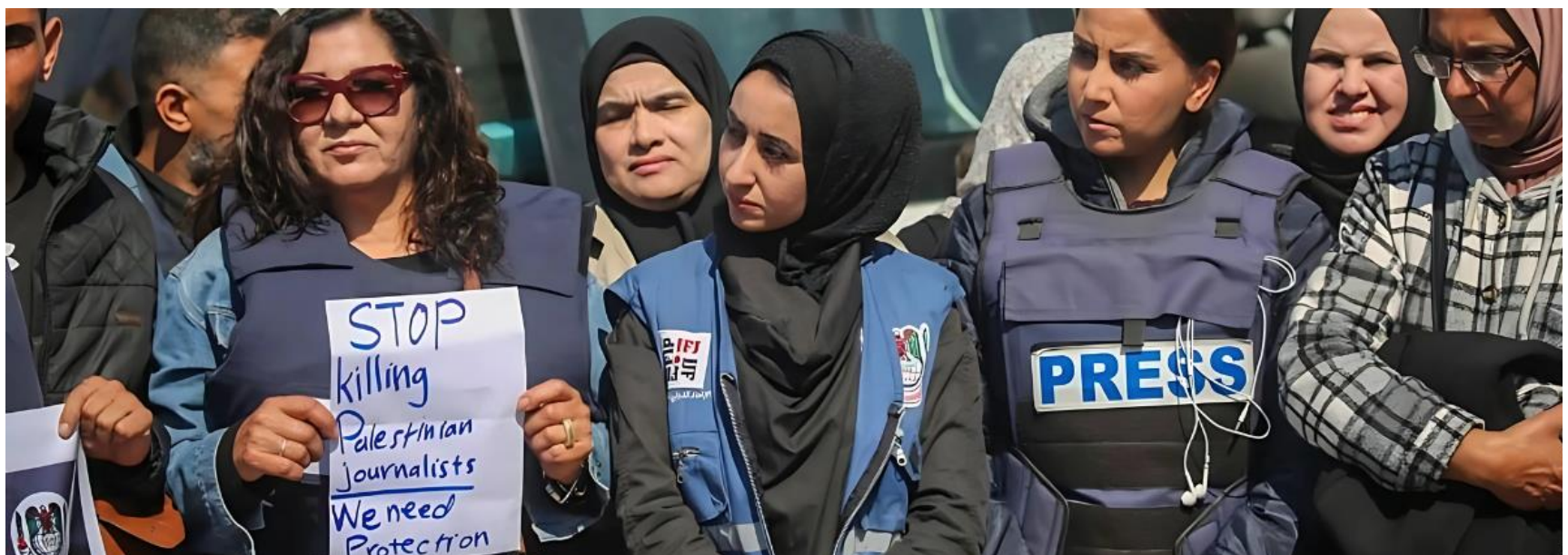
Des femmes palestiniennes en vestes de presse, dont l'une tient une pancarte contre le meurtre de journalistes palestiniens (Coalition for Women in Journalism, 2025).