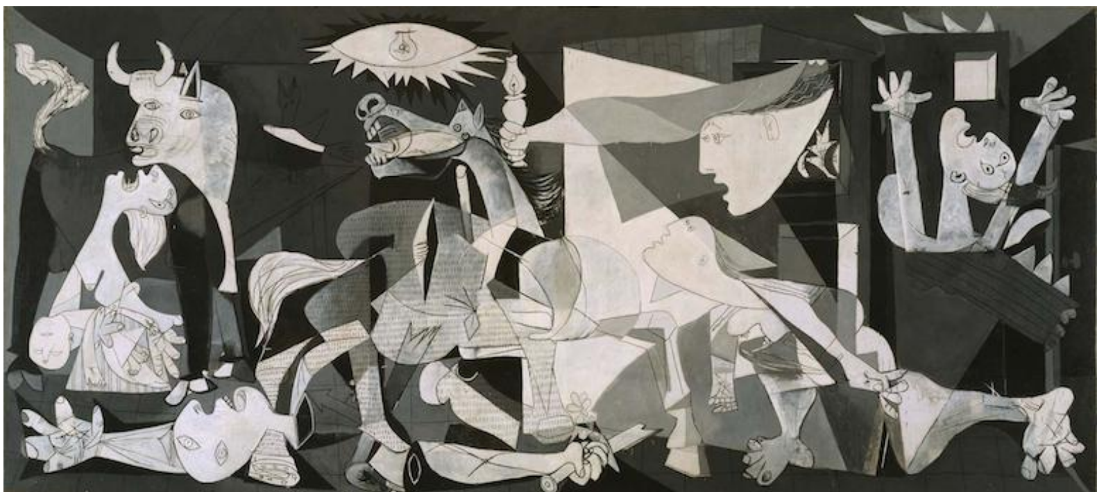
Guernica (Picasso, 1937).

Bien que le travail de Montellier puisse être critiqué comme une forme de féminisme occidental blanc, notamment à travers sa manière infantilisante de parler de Razan et ses références parfois forcées à ses amitiés avec des personnes de couleur, son livre reste essentiel pour amplifier les voix marginalisées et attirer l'attention sur la violence envers les Palestiniens. Son art assure que l'héritage de Razan transcende les statistiques et les titres de journaux, rendant visible qui était invisible et donnant la vie à son histoire, en particulier dans une société